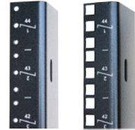
Rails de montage E.I.A.