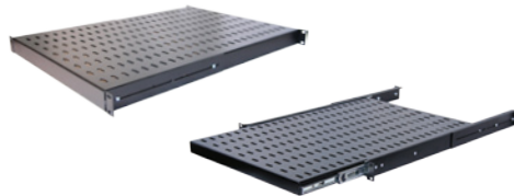
Tablettes: fixes, coulissantes à 4 points de montage