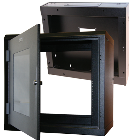
RFM-2436-WM (montré avec une extension de 6")