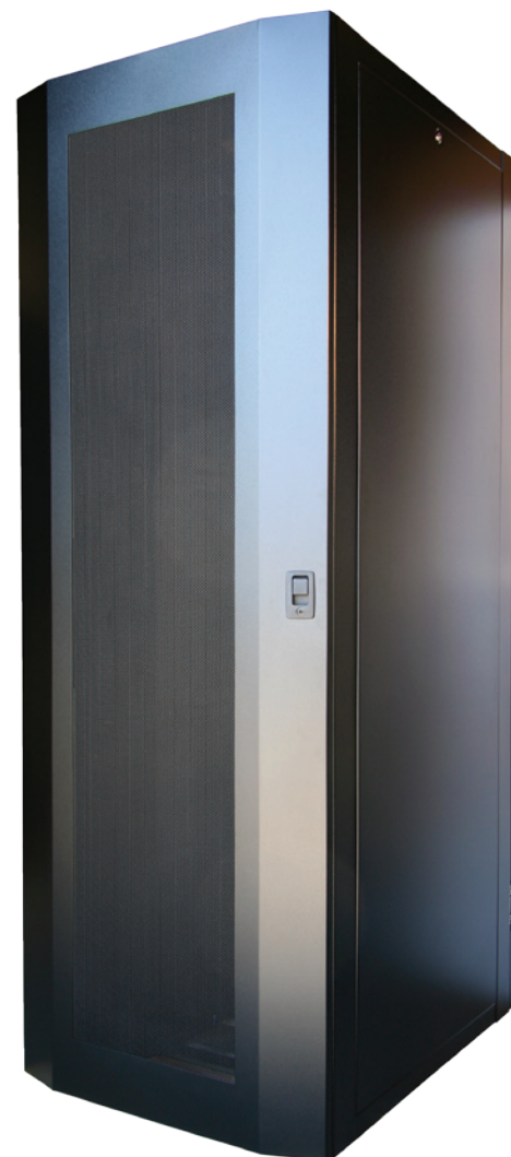
RFM-FORTRESS-1 (porte perforée, panneaux latéraux pleins)

Les membrures croisées de style Raceway permettent de déplacer indépendamment les rails de montage E.I.A., gérer les câbles à l'intérieur du cabinet et les positionner à l'extrême position avant ou arrière du cabinet.